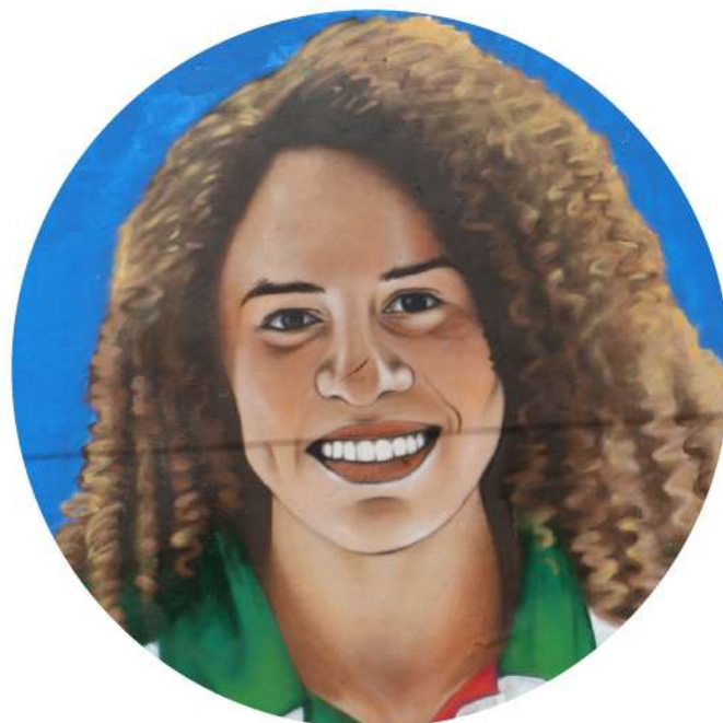
BYANCA MELISSA RODRÍGUEZ

(Chihuahua, Chih., 1994). Es una destacada nadadora olímpica mexicana, considerada una de las máximas referentes históricas del país en el estilo de pecho.